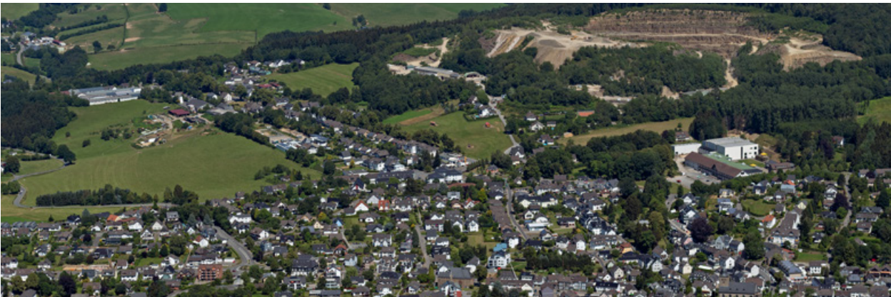
..... Blick auf die Steinbrüche bei Lindlar

Die Programmatik der REGIONALE 2025 war bereits vor der Corona-Pandemie in den einzelnen Handlungsfeldern und Themenlinien auf eine dezentrale Stärkung des Bergischen RheinLandes ausgerichtet und erfährt nunmehr eine Be-