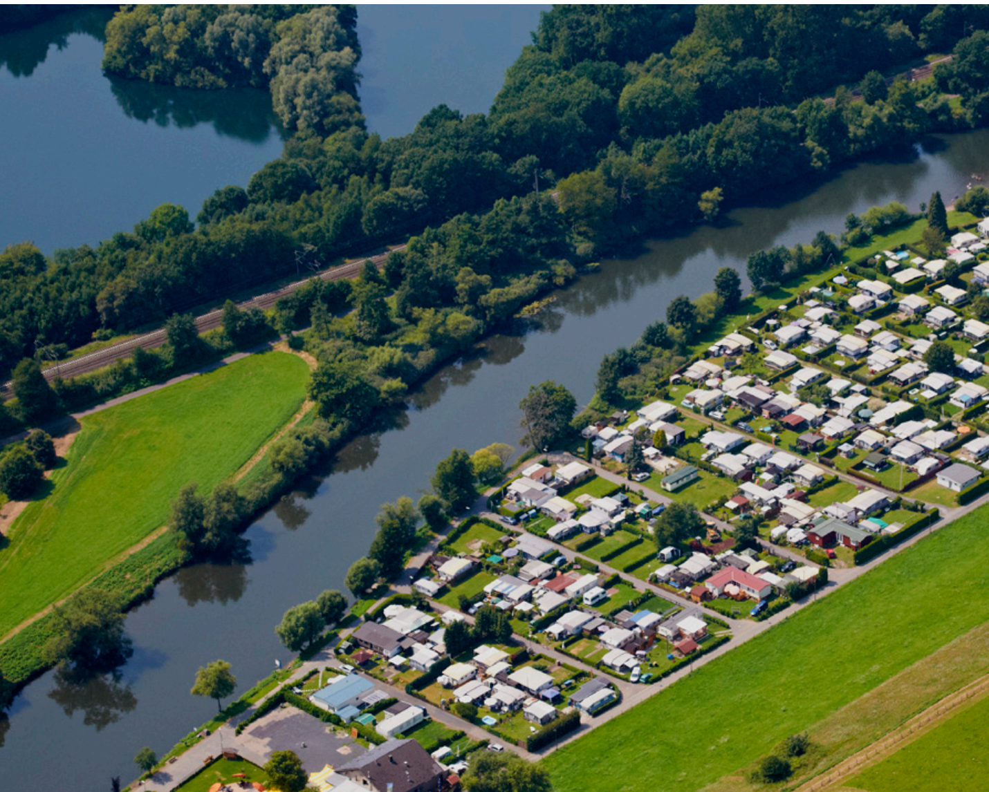
• Campingplatz am Dondorfer See bei Hennef