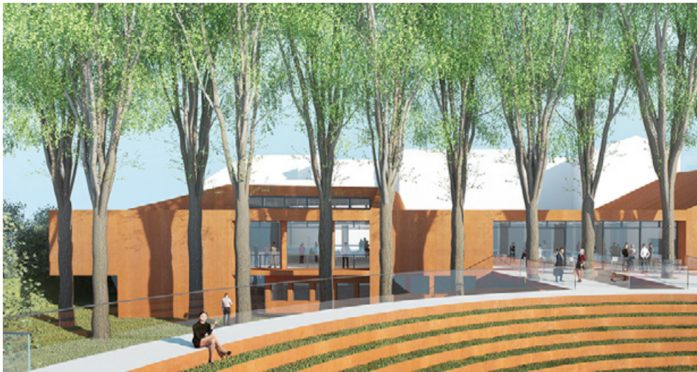
Neues A-Projekt: „Haus der Kultur(en)“ in Burscheid. Visualisierung: Archwerk Generalplaner AG